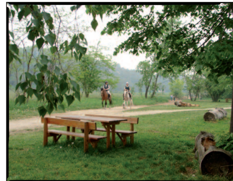
Area relax Santuario degli Angeli

Si è concluso il monitoraggio delle attività imprenditoriali esistenti nell'area del parco, in particolare attività agricole, artigianali e legate al tempo libero. Dal monitoraggio è emersa non solo una mappatura delle aziende presenti sul territorio, ma anche la loro propensione a collaborare con il parco per individuare risorse e opportunità di sviluppo, e la loro capacità di innovazione in termini di tutela e rispetto dell'ambiente. L'obiettivo del progetto è di valorizzare le imprese capaci di sfruttare le potenzialità turistiche e le altre opportunità offerte dal parco. Complessivamente sono state contattate 90 aziende con le quali si intende ora avviare un dialogo. Nei prossimi mesi verranno presentati i risultati dell'indagine mediante una conferenza pubblica a cui saranno invitati tutti gli attori interessati.